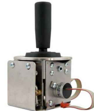
JMS3 Para mayor precisión