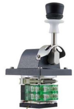
NSO-SFA Para requisitos extremos