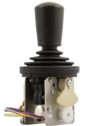
ST4 Resistente a la intemperie 1 eje