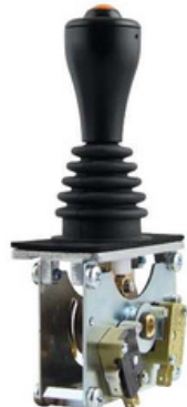
STO El sólido