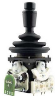
MON Pequeño, robusto, fiable