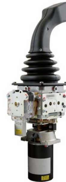
VNSO-Ex Protección antideflagrante