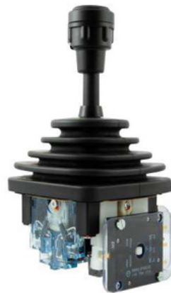
VCSO Nuestro clasico