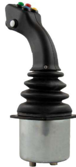
NS3 Nuestro BUS professional