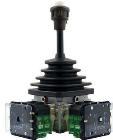
VNSO El todoterreno