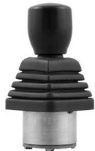
HS0 3D-HALL joystick pequeño