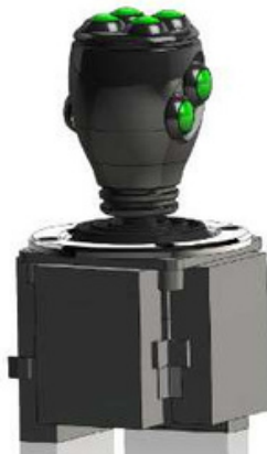
NS1 BUS professional pequeño