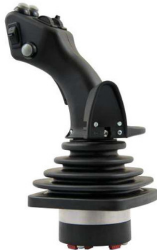
HS2 3D-HALL Para mayor demanda